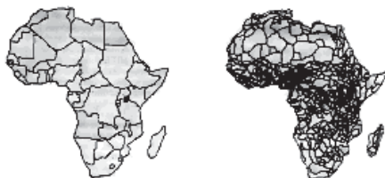
Mapas das Fronteiras Políticas e Étnicas da África

Fonte: Adaptado de GLASSNER, Martin Ira - "Political Geography". London, 2004.