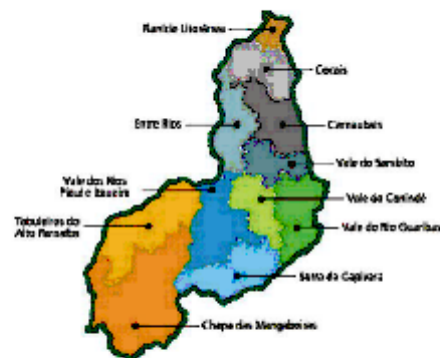
MAPA; Nº 01