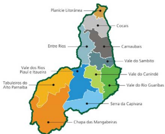
MAPA Nº 01