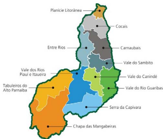
MAPA: Nº 01

37. Observe o mapa abaixo e indique a localização do município de Francinópolis na nova geografia do desenvolvimento: