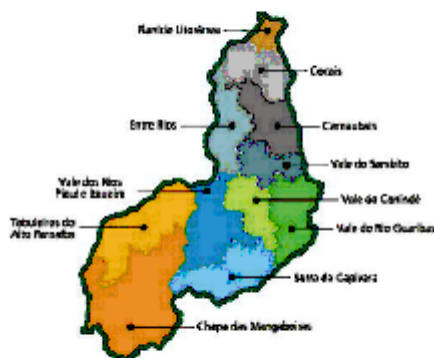
MAPA; Nº 01