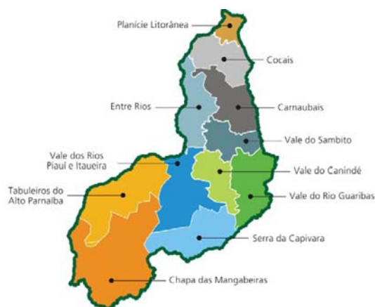
MAPA: Nº 01