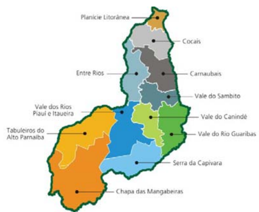
MAPA: Nº 01

38. Com base no mapa abaixo e em seus conhecimentos, aponte o território de desenvolvimento em que fica situado o município de Jatobá do Piauí